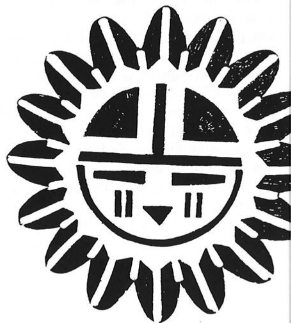
Bijou indien contemporain (Arizona).

Éditions ÉDISUD La Calade, RN 7, 13090 Aix-en-Provence, France Tél : (33) 42 21 61 44 - Fax : 42 21 56 20