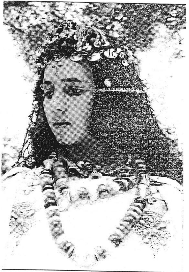
El Kela des Mgouna.